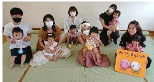
元気が出る子育てクラブ