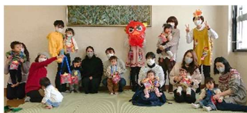
元気になる子育てクラブ